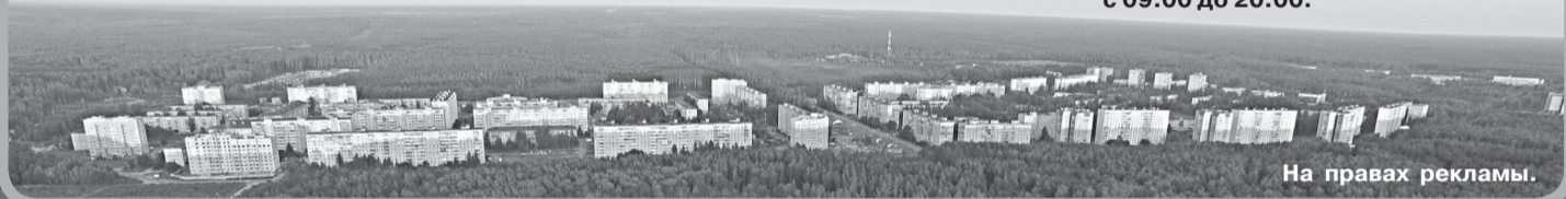
На правах рекламы.

- Работа батутного городка, велосипеды, квадроциклы, уличная торговля (мороженое, карамелизированные яблоки, воздушные шары). с 09.00 до 20.00.